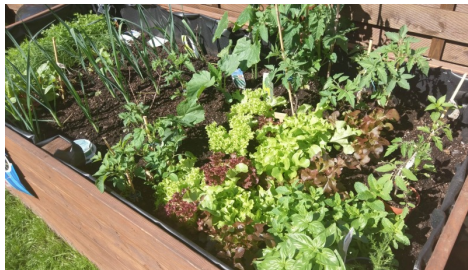
Anschaffung von Hochbeeten inkl. Jährlicher Finanzierung der Erde und Sämlinge