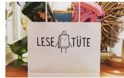
Organisation von „Lesetüten“ für die Erstklässler/innen & Willkommensgutschein über eine Kugel Eis u.v.m.

Auch in Zukunft möchten wir die Kinder der Grundschule fördern und bitten Sie deshalb um Ihre Beteiligung. Nur so können wir die Kinder bei Dingen unterstützen, bei denen es vom Schulträger keine Zuschüsse gibt, sei es die Verpflegung bei Veranstaltungen, Zuwendung bei Ausflügen oder kleine Überraschungen.