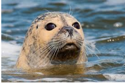
Besuch von der Schutzstation Wattenmeer