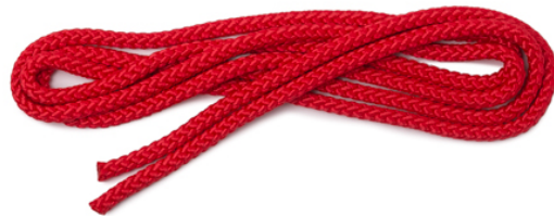
Anschaffung von Springseilen für jede/n Schüler/in während des Homeschooling